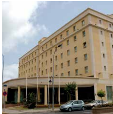
Hotel Tryp Melilla Puerto 4* Explanada San Lorenzo, s/n. Tel.: 952 695 525. Fax: 952 695 506 www.hotelmelillapuerto.com