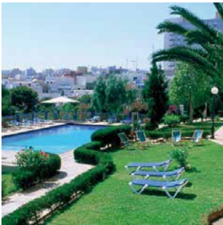
Hotel Parador de Melilla 3* C/ Cándido Lobera, s/n. Tel.: 952 684 940. Fax: 952 683 486 melilla@parador.es