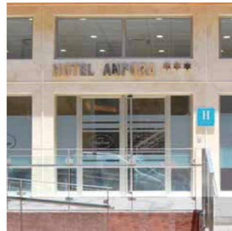
Hotel Ánfora 3* C/ Pablo Vallesca, 16. Tel.: 952 683 340. Fax: 952 683 344 www.hotel-anfora.com

Precios finales por persona en habitación doble, en régimen de alojamiento y desayuno. Los potenciales incrementos del carburante se pondrán en conocimiento del consumidor con la suficiente antelación a la salida. El precio no incluye propinas ni otros gastos o servicios que deba asumir el consumidor sin tener que abonarlos a la agencia. Depósito 30% y pago final 15 días antes de la salida. Plazas limitadas. Las condiciones generales están a disposición del cliente en la oficina y en www.halconviajes.com , así como están sujetas a lo dispuesto en el Real Decreto Legislativo 1/2007, de 16 de noviembre, por el que se aprueba el Texto Refundido de la ley general de consumidores y usuarios y otras leyes complementarias (BOE 30-11-07). En caso de anulación de los billetes de barco, una vez emitidos supondrá la pérdida del importe total de los mismos. No incluye gastos de gestión (18€ por reserva). PLAZAS LIMITADAS. PRECIOS DESDE